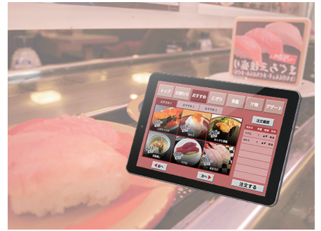
大手寿司チェーン オーダー端末