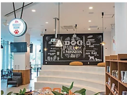
都内ドッグカフェ イベント可能なAV設備一式