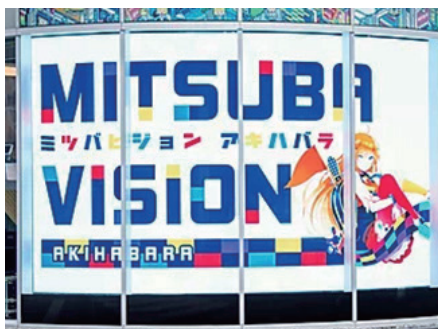
都内主要駅前ショーウィンドウ アクチュエーターシステム