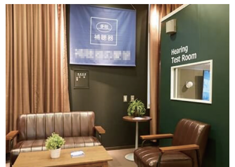
大手メガネチェーン 新規補聴器ビジネス用防音室