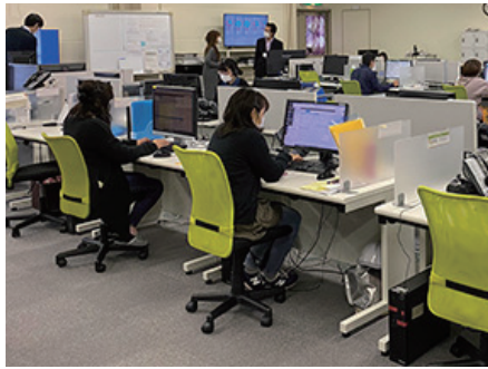
海外PCモニターメーカー 国内コールサービス