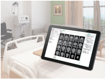
大手医療用ベッドメーカー ベッドサイド端末