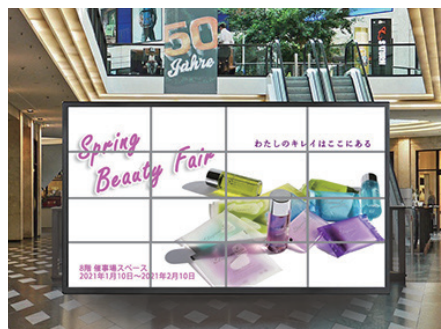
大手ショッピングモール 16面マルチ、マグネット施工