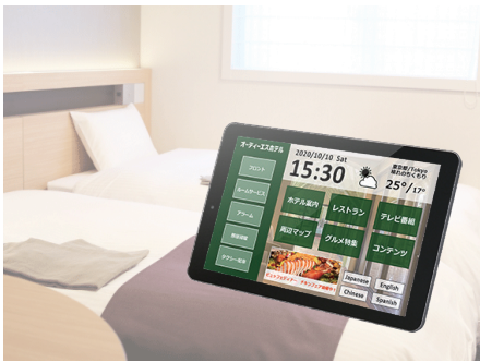
ホテル向けサービス企業 客室タブレット