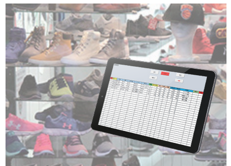
大手小売りチェーン 販売補助端末