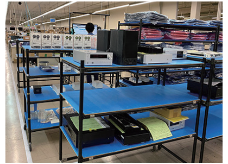
大手音響機器メーカー 修理・リペア部門