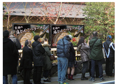
有名ラーメンチェーン 屋外用単独使用