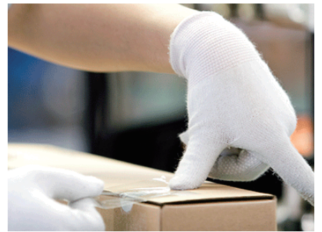
アパレルメーカー ダイレクト販売支援