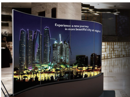
大手部品メーカーエントランス 多面マルチ曲面加工