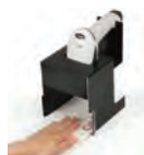
STND-P1 ・パスポート読み取り専用スタンド